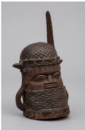
Gedenkkopf eines Chiefs

Königreich Benin, Nigeria, 19. Jh. Holz mit Messingbeschlag: H 57,5 cm; B 30 cm; T 27 cm