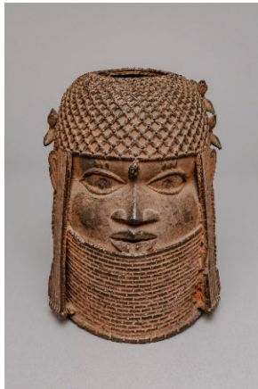
Gedenkkopf eines Königs Unbekannte Werkstatt der Bronzegießergilde Igun Eronmwon , Königreich Benin, Nigeria 16. Jh. Gelbguss, H 26,8 cm, B 19,3 cm Übernahme von Museum für Kunst und Gewerbe Hamburg 2021, MARKK 2021.22:3