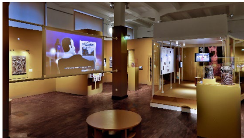
Ausstellungsansicht „Benin. Geraubte Geschichte“ im MARKK