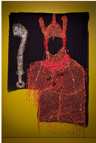
Ich bin Ogiso, der König vom Himmel Victor Ehikhamenor, 2017 Rosenkranzperlen, Faden auf Spitzentextil Leihgabe des Künstlers