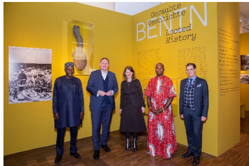
Ausstellungsansicht „Benin. Geraubte Geschichte“ im MARKK