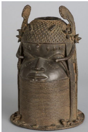
Gedenkkopf eines Königs uhunmwun elao Unbekannte Werkstatt der Bronzegießergilde Igun Eronmwon , Königreich Benin, Nigeria, 19. Jh. Gelbguss, H 47,5 cm, D 32 cm Ankauf von J. F. Blech, 1898, MARKK C 2340