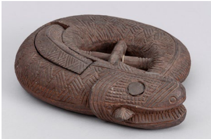
Holzschachtel in Form eines Welses

Königreich Benin, Nigeria, 19. Jh. Holz: B 34 cm; H 7 cm; T 29 cm