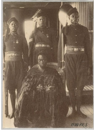
Oba Ovonramwen in Gefangenschaft auf der britischen Yacht Ivy am Weg ins Exil nach Calabar